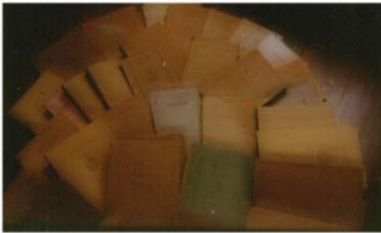
หนังสือที่หลงตาใช้ศึกษาระหว่างการเรียนปริยัติธรรม ยังคงเก็บรักษาไว้ในสภาพที่สมบูรณ์