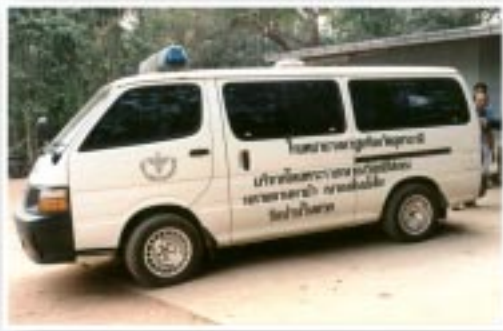
รถพยาบาลที่หลวงตาให้ความอนุเคราะห์

วันนี้เปิดเสียให้ชัดเจน เราไม่เคยพูดแหละคำอย่างนี้ทั้งๆ ที่ไปปฏิบัติหน้าที่