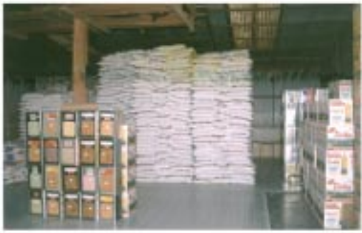
โรงงานขนาดใหญ่ ใช้เก็บเครื่องอุปโภคบริโภค ที่หลวงตานำไปแจกทาน

ไปไม่ได้เต็มเม็ดเต็มหน่วย แต่ว่าเต็มรถนะ หากไม่เต็มเม็ดเต็มหน่วยเพราะแบ่ง ๒ โรง อยู่ใกล้กัน ถ้าไปโรงเดียวก็เต็มรถ เทปจะเลย ได้มาก เอาไป ๒ โรงก็ต้องแบ่งครึ่ง แต่รถนั้นเต็มรถ วันนี้จะเป็น ๒ โรง มันใกล้ ๓ ชั่วโมงกว่า กว่าจะถึง... ไปส่งแล้วกลับ ขนาดนั้นค่าพอดีๆ...”