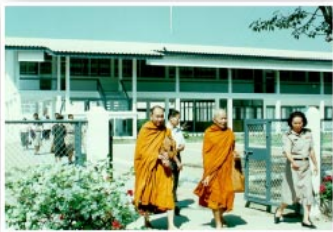
หลวงตามะตาดำจัดสร้าง “เรือนบัวภุณา” ใช้เป็นสถานที่อภิบาลเด็กแรกเกิดในทัณฑสถานหญิง

คนใจคอกว้างขวางไปไหน เพื่อนฝูงก็มาก เวลาตายนี้ คนเต็มไปหมดใน