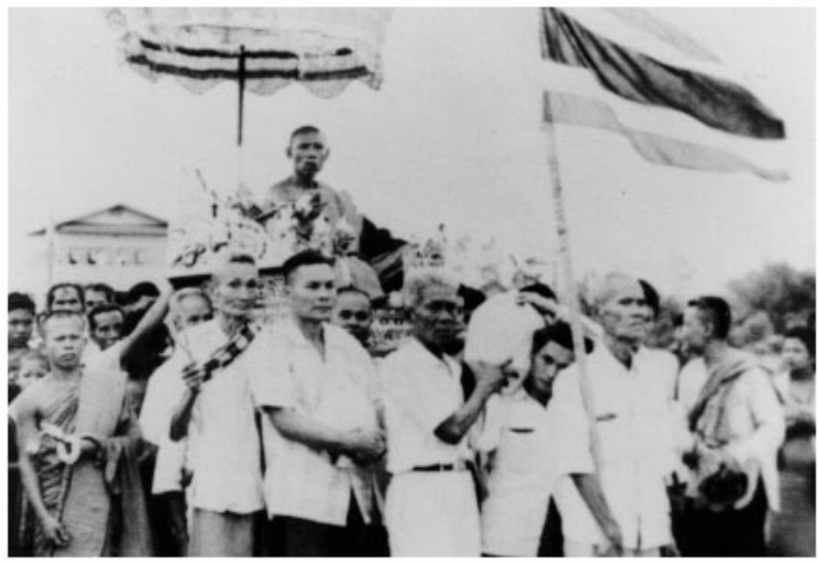
ท่านพ่อลี กับศิษยานุศิษย์