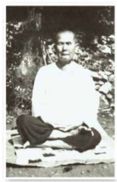
ท่าน ก. เขาสวนหลวง

ถ้าเป็นพระเคารพธรรมเคารพวินัย คุณยายท่านก็ไม่เป็น... จะว่าอะไร แม้แต่เราเองก็ไม่ต้อนรับพระประเภทนั้นเหมือนกัน...”