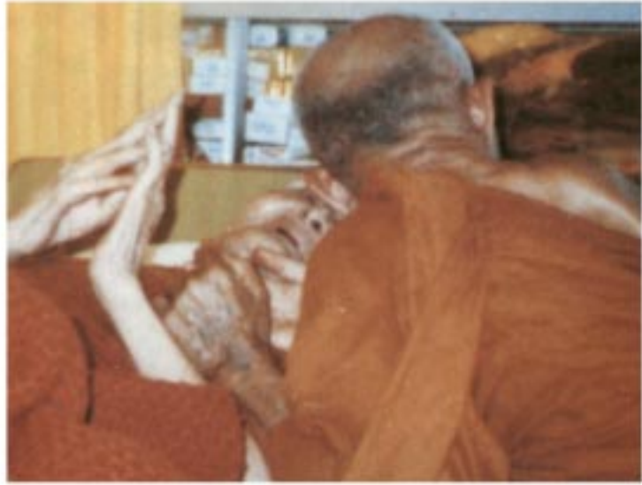
คร่าวเยียมอาพาธหลวงปู่ขาว อนาลโย ณ วัดถ้ำกลองเพล จ.หนองบัวลำภู

อะไรอีก ห่วงไฟเผาเจ้าของมันมืออย่าง เหวอ... ท่านพร้อมอยู่แล้วที่จะติด ตั้งแต่ ระยะช่วยตัวเองไม่ได้แล้วนั้น... ครูบา อาจารย์จะตายแล้วไม่ยอมให้ไป ไม่ให้ ตาย เอาไฟจี้ไว้อย่างนั้น ระวังระยงเต็ม หมด ออกซิเจนช่วยลมหายใจ ช่วยลม หายใจอะไร ช่วยไฟเผาว่านี่จึงถูกนะ