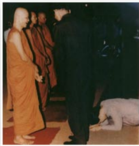
หลวงตาเป็นประธาน ในงานพระราชทานเพลิงศพ หลวงปู่ขาว อนาลโย

ขนาดหลวงปู่ขาวแล้วท่านจะมี ปัญหาอะไร ว่างั้นเลย จะตายทำไหนก็ ตายซี ทำทายก็ได้ เอหิภัสสิโก ทำทาย ธรรมของจริงได้... ดิถีเดี่ยวไปเลยว่าจะ ไม่อยู่แล้วไม่อยู่แล้ว มันก็หมดแล้วนะนี่ พระ ประเภทเพชรน้ำหนึ่งๆ หมดไปๆ...”