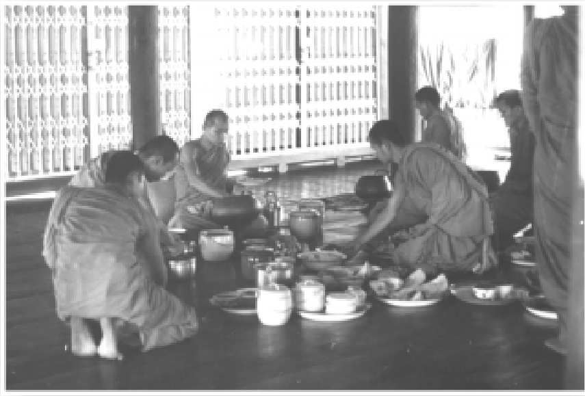
กำลังจัดอาหารถวายหลวงตา บนศาลาวัดป่าบ้านตาด ๑๑ มกราคม ๒๕๐๘

ความคิดก่อตั้งวัดป่าบ้านตาดจึงเกิดขึ้น ด้วยเหตุผลนี้เอง