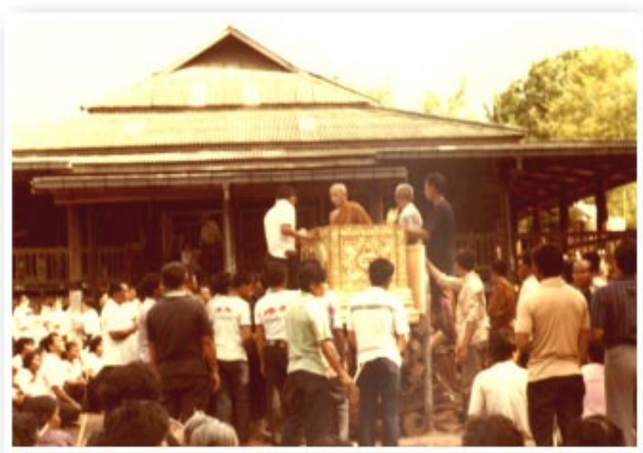
หลวงตาขึ้นตรวจดูความเรียบร้อยด้วยตนเองก่อนการฉาบปูนกิจกรรมโยมมารดา บริเวณหน้าศาลารัตบ้านตาตาด