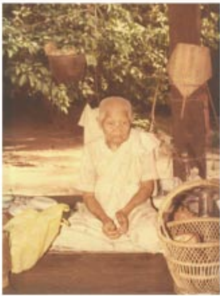
โยมมารดาของหลวงตา

“...ร่างกายเจ็บไข้ได้ป่วยก็จริง แต่ใจนั้นใสสว่างกระจ่างแจ้ง อยู่ตลอดเวลา...”