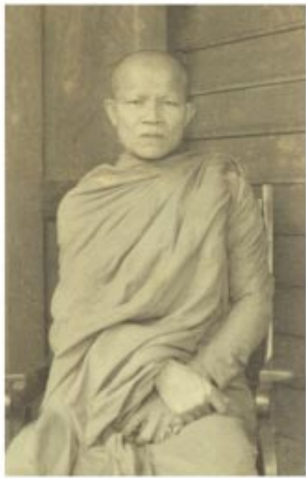
หลวงตา (ถ่ายเมื่อเดือนมีนาคม ๒๕๐๐)

โยมมารดาได้จากโลกนี้ไปด้วย อาการอันสงบเมื่อมีอายุย่างเข้า ๙๓ ปี ตรงกับวันที่ ๓๐ พฤษภาคม พ.ศ.๒๕๒๕ และด้วยเหตุนี้เองในทุกๆ ปีของวันที่ ๓๐ พฤษภาคม (วันทำบุญโยมมารดา) ท่าน ไม่เคยละเว้นและไม่ลืมที่จะทำบุญระลึก ถึงพระคุณโยมมารดา สิ่งนี้ย่อมแสดงถึง ความซาบซึ้งในบุญในคุณของโยมมารดา แบบไม่สร้างชา