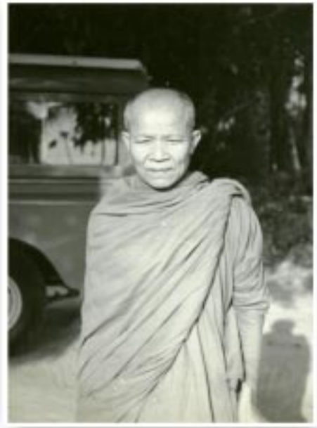
หลวงตา ณ วัดป่าบ้านตาด (ถ่ายเมื่อ ๒๗ มกราคม ๒๕๑๑)

ครั้งเมื่อมีประธานที่ปรึกษาที่เด็ดขาดจริงจังและประกอบด้วยเหตุผลอรรถธรรมเช่นท่านเป็นผู้ตัดสินใจรวมอยู่ด้วยแล้ว งานนั้นๆ มักผ่านไปได้อย่างราบรื่นทุกครั้งทุกครั้งไป เป็นที่อบอุ่นเย็นใจแก่ผู้เกี่ยวข้องทุกฝ่าย