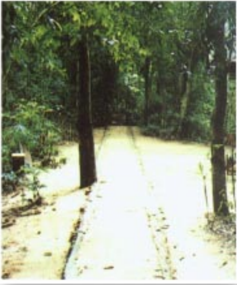
ทางจงกรม

“...มันก็ฟุ้งนะสิ มีแต่ว่าตายเท่านั้น เรื่องแพ้ไม่พูดเลย แพ้ก็ต้องแบกหามลงเปลไปเลย ที่จะให้ยกมียอมแพ้นั้นไม่มี ชัดกันขนาดนั้น... ถ้าได้ลงทางจงกรมแล้วมันไม่รู้จักหยุด ไม่ว่าจะเวลา รอนหนาวมันไม่ได้สนใจ คือจิตมันอยู่ที่นี้ มันไม่ได้ออกนะ ออกไปตามดินฟ้าอากาศนี้ไม่ได้ ออกไปหาร่างกายนี้วันหนึ่งมันก็ไม่ได้ ออก มันพัดกันอยู่ภายในเหมือนนักมวยเข้าวงใน ว่ามันเถอะนะ ใครจะไปสนใจเรื่องความเจ็บความปวด มันไม่สนใจนะ