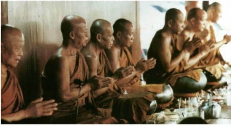
หลวงตากับครูบาอาจารย์ที่เคยติดสอยห้อยตาม หรือเคยอยู่ศึกษาที่หลวงตาที่วัดป่าบ้านตาดในระยะต้นๆ (ถ่ายเมื่อปี พ.ศ. ๒๕๓๗)