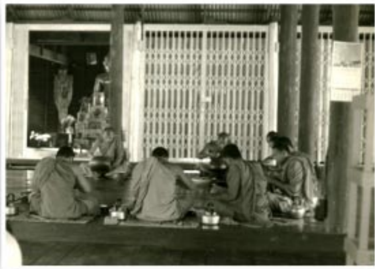
พระภิกษุที่อยู่ศึกษากับหลวงตา บนศาลาวัดป่าบ้านตาด (ถ่ายเมื่อ ๑๑ มกราคม ๒๕๐๘)

ธรรมเทศนาที่หลวงตาแสดงแก่พระ เณรผู้เข้ามาศึกษาอบรม... รุ่งแล้วรุ่งเล่า มิได้แตกต่างกัน คือท่านจะย้ายอยู่เสมอว่า