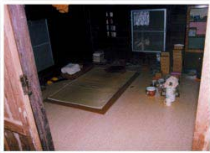
ภายในกุฏิหลวงตา