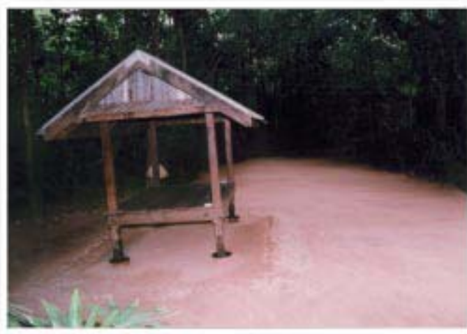
ทางจงกรมของหลวงตา