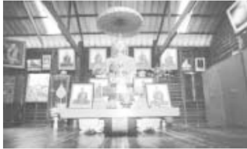
พระประธานบนศาลาการเปรียญ