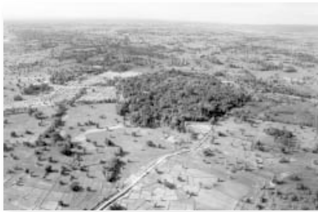
มุมมองด้านบน บริเวณที่ตั้งวัดป่าบ้านตาด

ณ ตำบลบ้านตาด อำเภอเมือง จังหวัดอุดรธานี บนพื้นที่กำแพงล้อมรอบประมาณ ๑๖๓ ไร่ ห่างจากตัวเมืองอุดรธานีไปทางทิศใต้ประมาณ ๑๖ กิโลเมตร เป็นสถานที่ปฏิบัติธรรมอันสงบเรียบง่าย ร่มรื่นไปด้วยต้นไม้สูงใหญ่นานาพันธุ์ เป็นสถานที่พึ่งพิงของสัตว์น้อยใหญ่ในเขตอุทยานหลากชนิด อาทิ ไก่ป่า กระรอก กระแต แย้ นก ฯลฯ ที่นั่นคือ วัดป่าบ้านตาด