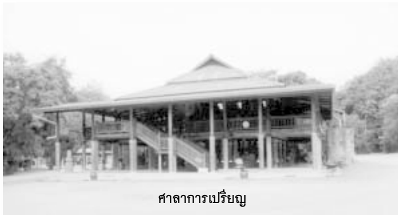
ศาลาการเปรียญ

ค้ำล่างศาลานั้นใช้เป็นที่สำหรับฉันภัตตาหารเช้า สถานที่ ที่หลวงตามหาบัวใช้ในการแสดงธรรมเทศนา และปฏิบัติธรรมาภิบาลกับศรัทธา ฆราวาส ญาติโยม ที่มาจากทุกสารทิศอย่างไม่ขาดสายไม่เว้นแต่ละวัน